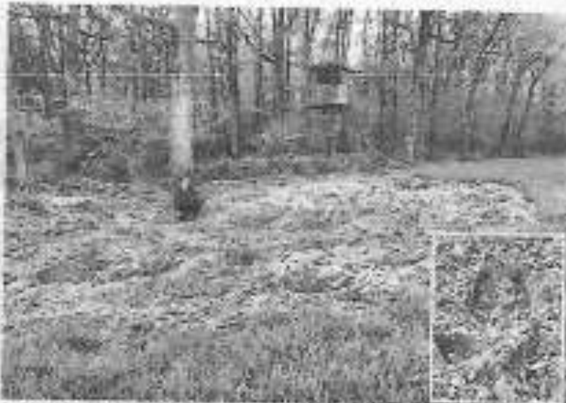
Le bout de parcelle de blé situé au pied du chêne ressemble à un terrain de blé-cros. Des sangliers en quête de glands sont passés par là.

Les empreintes fraîches laissées sur le sol ne font aucun doute. « Le gros solitaire » et sa famille ont encore fait un travail de cochon. Ce vendredi matin, au pied d'un grand chêne qui borde la parcelle, la terre du champ de blé naissant de la ferme D'hyverchies est sans dessus dessous. « Regardez, il y a des traces de mammelles aussi... Il est encore tout retouré pour trouver des glands », déplore Valérie Parent.