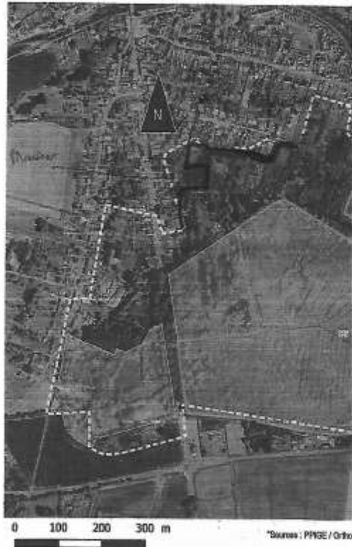
Carte 4 : Projet de RNN de la tourbière de Man hectares) et d'une propriété privée (Propriété (25,8 hectares).