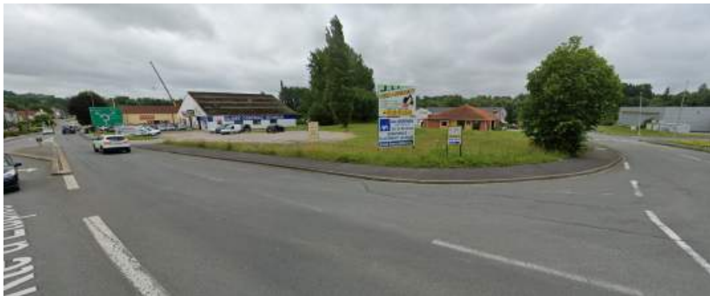
VUE 1 - PHOTO EXISTANTE SITUEE DANS LE PAYSAGE LOINTAIN