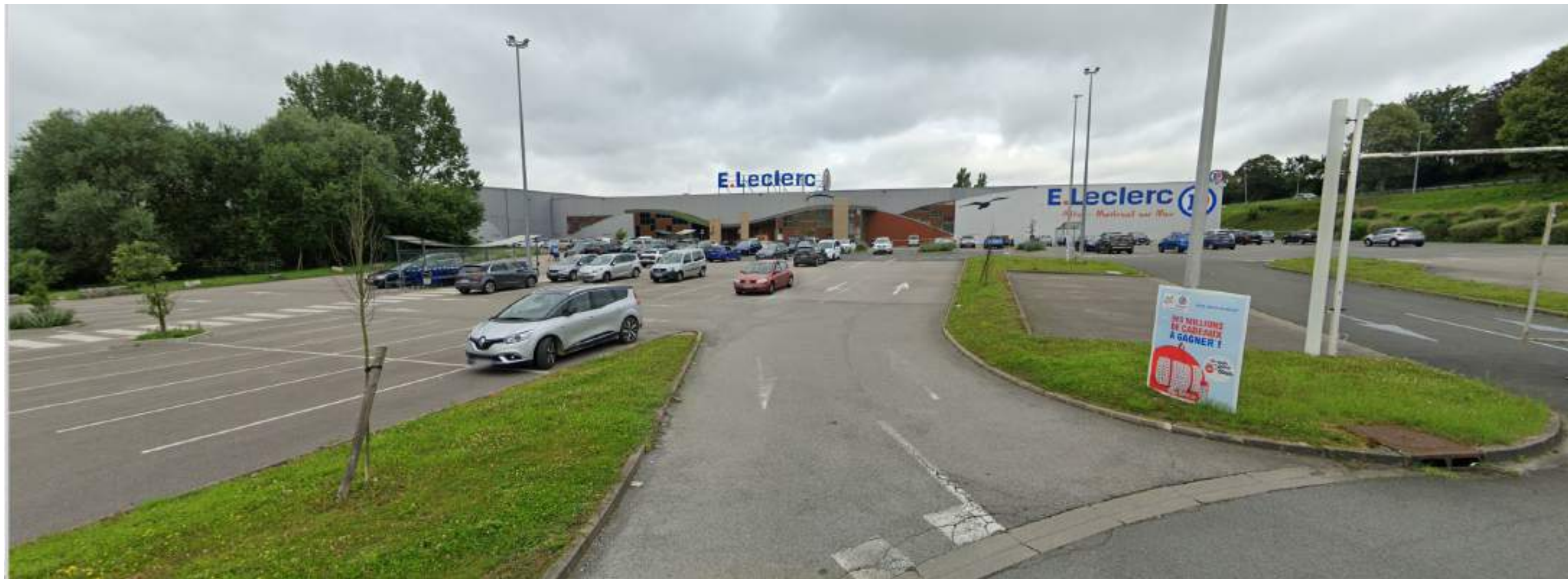
VUE 2 - PHOTO EXISTANTE SITUEE DANS L'ENVIRONNEMENT PROCHE