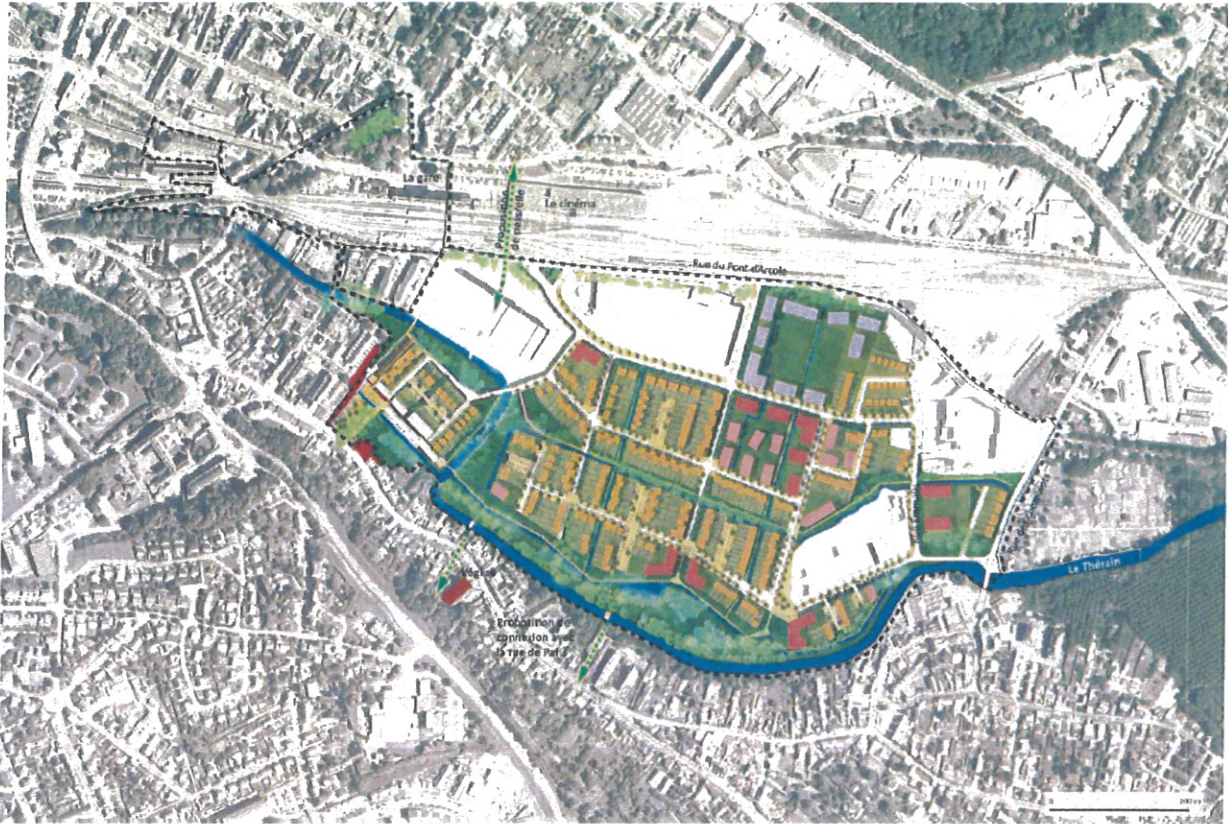
ZAC Beauvais Vallée du Thérain

ACTIVITES LOGEMENTS COLLECTIFS LOGEMENTS INTERMÉDIAIRES LOGEMENTS INDIVIDUELS