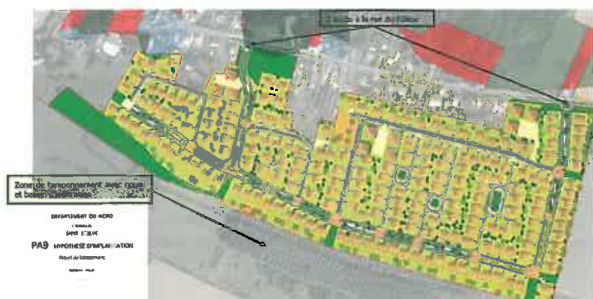
Plan d'aménagement de la zone.

L'Autorité environnementale considère que les principaux enjeux associés au projet concernent la préservation du milieu naturel, la gestion de l'eau, les déplacements et la santé.