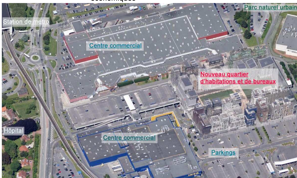
densification d'une zone commerciale bien équipée et bien desservie par le métro, par un programme de logements et de bureaux (vue d'artiste, DREAL NPDC)