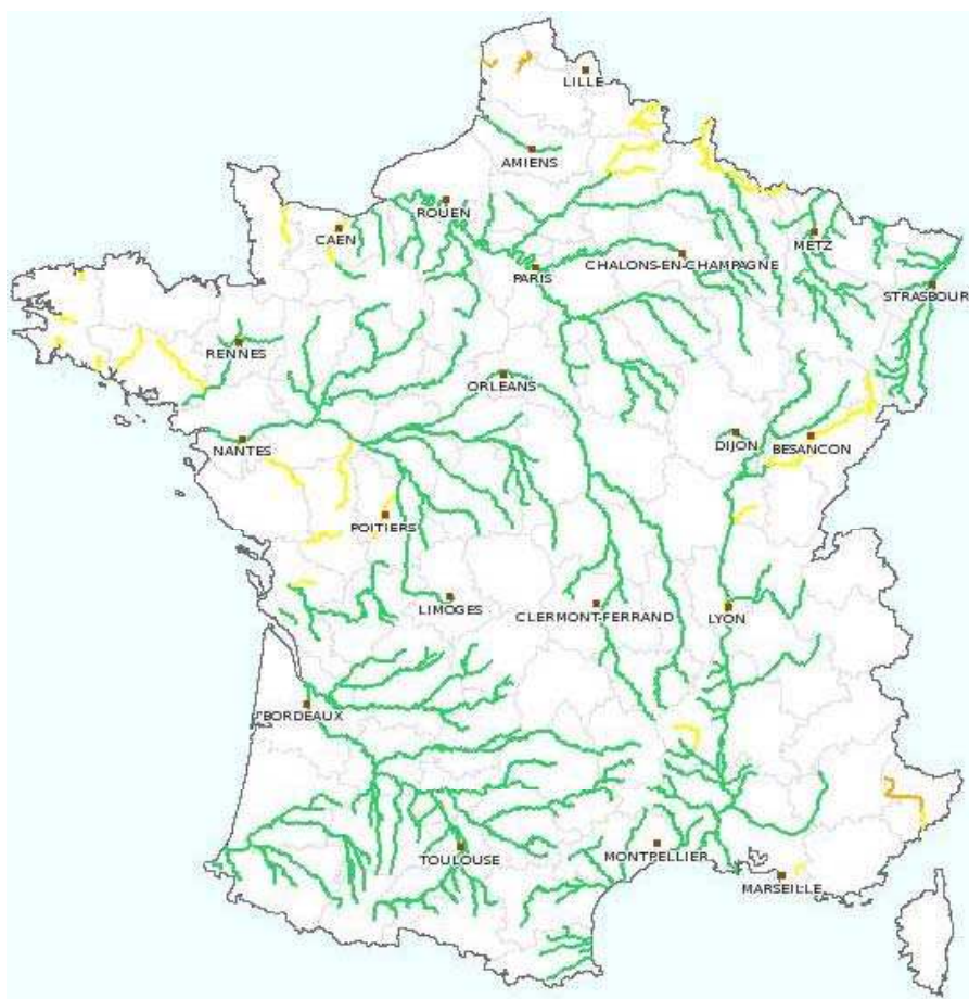
Carte nationale du 08/12/2006 à 10h00

Un service central d'Hydrométéorologie et d'Appui à la Prédiction des Inondations (SCHAPI) a été créé ; au niveau local, 22 Services de Prédiction des Crues (SPC) sont chargés de la surveillance et de la prévision sur les cours d'eau et ils transmettent leurs informations au SCHAPI qui les agrège. Pour le bassin Artois-Picardie, il y a un SPC unique, appelé SPC Artois-Picardie, placé au sein de la DIREN Nord-Pas-De-Calais.