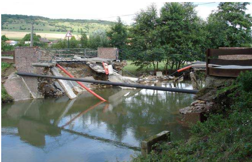
Crue de la Hem en Août 2006