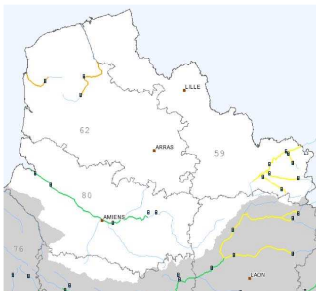
Carte locale du 08/12/2006 à 10h00

une carte de vigilance crues élaborée systématiquement deux fois par jour à des horaires réguliers (10 heures et 16 heures) pour une échéance d'anticipation de 24 heures. Cette carte peut être consultée à l'échelle nationale et à l'échelle locale du territoire de compétence de chaque Service de Prévision des crues (SPC), des bulletins d'information locaux, rédigés par les SPC, et nationaux rédigés par le SCHAPI, accessibles depuis la carte de vigilance crues, des mesures brutes de niveau ou de débit observés en temps réel au niveau des stations de référence situés sur les cours d'eau surveillés.