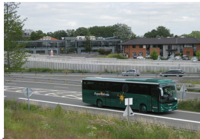
E- 2 parois clouées pour permettre la création de l'accès direct Grand Stade