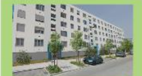
Résidence JEAN MOULIN 40 logements - Amiens