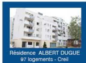
Résidence ALBERT DUGUE 97 logements - Creil