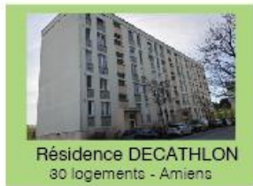
Résidence DECATHLON 30 logements - Amiens