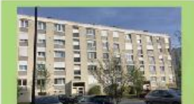
Résidence DISCOBOLE 20 logements - Amiens