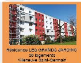
Résidence LES GRANDS JARDINS 50 logements Villeneuve Saint-Germain