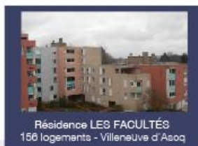
Résidence LES FACULTÉS 156 logements - Villeneuve d'Ascq