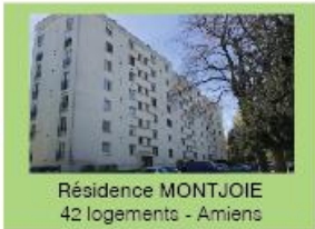
Résidence MONTJOIE 42 logements - Amiens