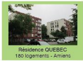
Résidence QUEBEC 180 logements - Amiens