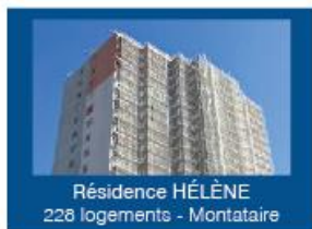
Résidence HÉLÈNE 228 logements - Montataire