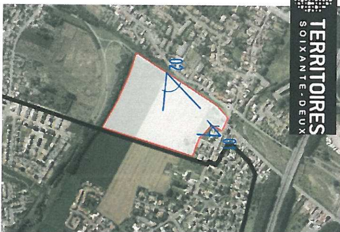
▲ Photographie 01 - Mai 2012