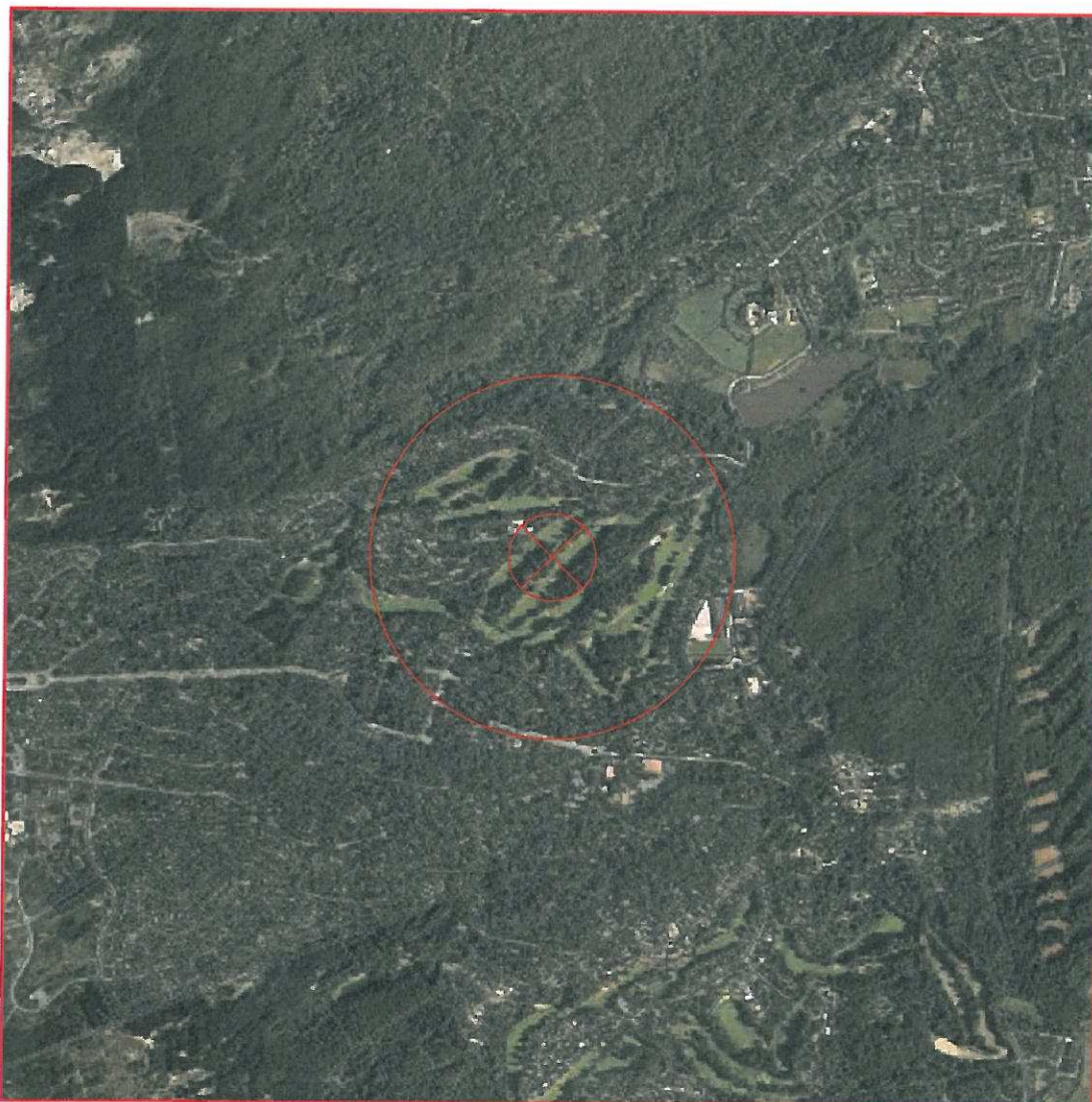
Extrait du Portail Géofoncier®