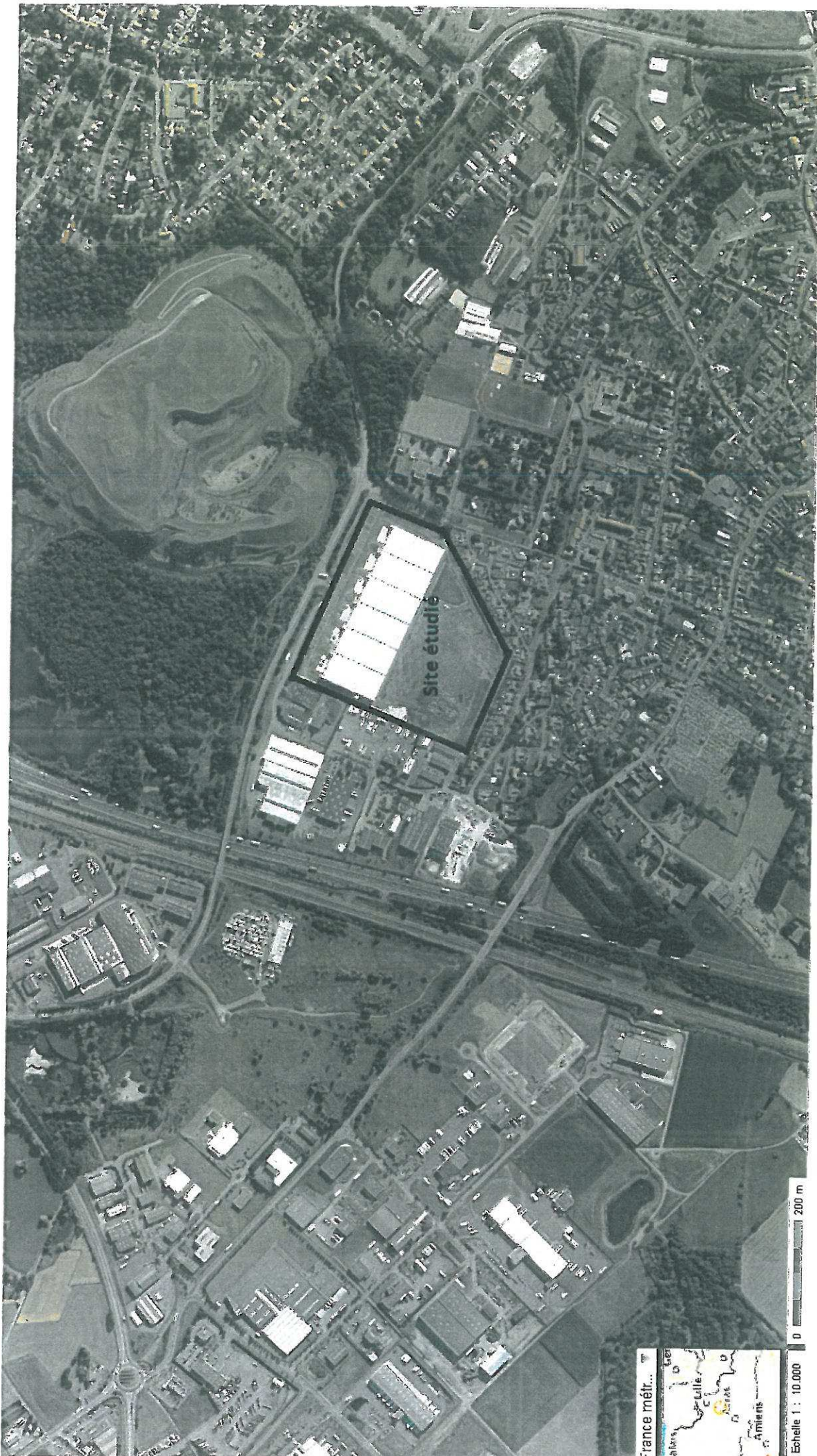
Photo environnement proche Annexe 3