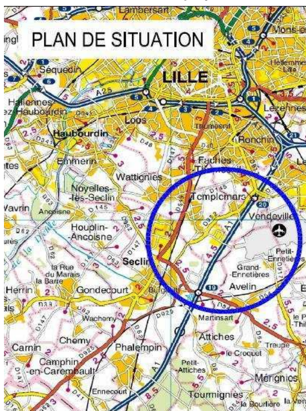
Plan de situation du projet

Le résumé non technique se lit facilement. L'Ae recommande toutefois de l'agrémenter de schémas et de coupes pour montrer les aménagements réalisés.