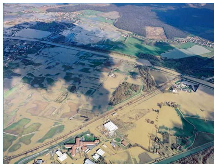
La commune la plus touchée est St-Omer.